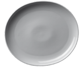
450 032 Teller oval Plate oval 32 cm 1020 g