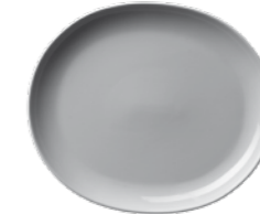
450 027 Teller oval Plate oval 27 cm 755 g