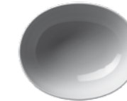
450 022 Schale oval Bowl oval 22 cm 615 g