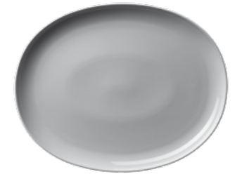
450 040 Platte oval Platter oval 40 cm 1680 g