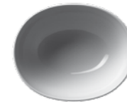
450 060 Suppenschale Soup bowl 0,6 l 350 g